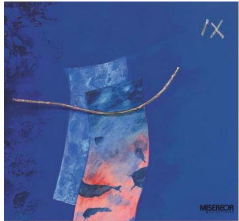
Ausschnitt aus dem Hungertuch

Die rot-blau bekleidete Gestalt rechts hat anmutig die Arme erhoben, die Balance haltend zwischen Hören und Handeln: Wofür stehe ich ein? Nehme ich die Botschaft Gottes und der Mit-Welt wahr und was erzählen sie mir? Die Potentiale der Menschen zusammenzuführen in dem „einen Haus“ – das ist das Projekt Gottes!